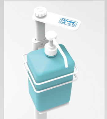
ポンプの設置、交換も簡単