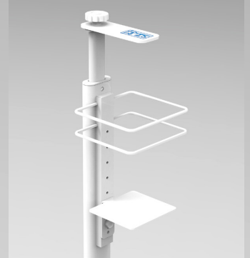
ポンプ合わせて高さを調整

設置可能なポンプの最大寸法 約 W106×D92×H324mm (最低H111mm) ※ポンプ台固定ツマミの取付位置 によっては以下寸法となります。 約 W106×D84×H324mm