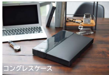
コングレスケース