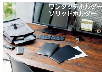
ワンタッチホルダー ソリッドホルダー