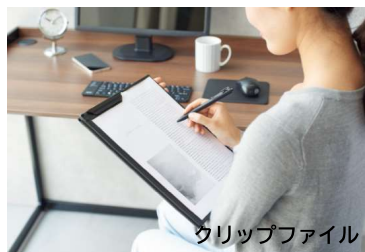
クリップファイル