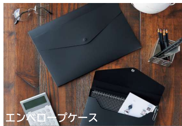
エンベロープケース 便利なマチつき