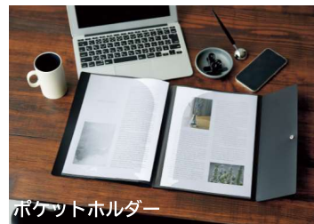
ポケットホルダー A3資料も見開きで持ち歩けます