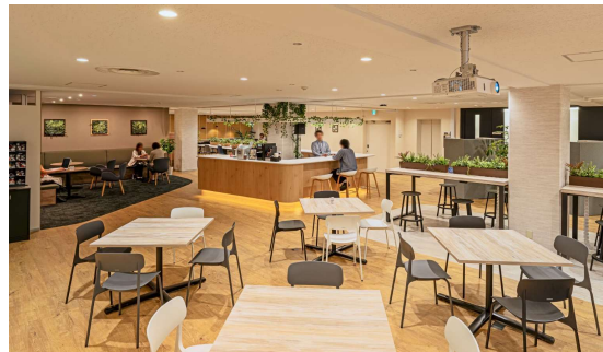
コミュニケーションエリアとして位置づけ、自席を離れてワークスペースとして利用もできる。