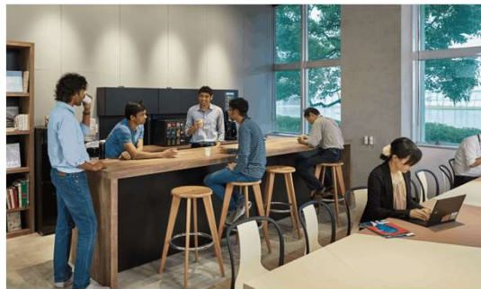
ドリンクコーナーのそばにカウンターとハイチェアを配置。たまたま居合わせた人と気軽に会話ができるスペースに。

加えて、上記のようなメリットに魅力を感じる採用候補者へのアピールや、企業のブランディングにつながる効果もあります。