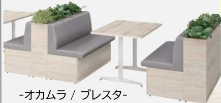
-オカムラ / プレスタ-

気軽な交流スペースだけでなく、仕事スペースとしても使用でき、社員が自然と集まるコミュニケーションエリアとして活躍！