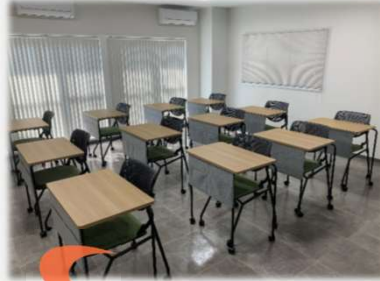
オフィスレイアウト プランニング