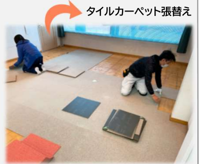
タイルカーペット張替え