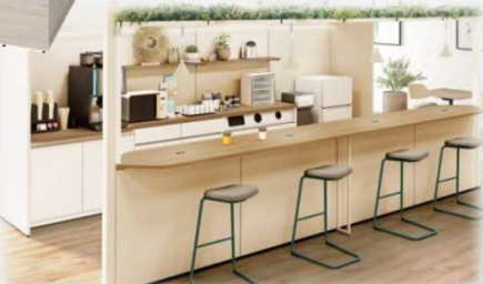
-オカムラ / ライブス ポスト ビーム-