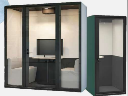
-オカムラ / テレキューブ-

床・壁・天井すべての面が囲われた個室空間です。遮音・吸音・照明・換気各機能を完備。最高の集中環境を提供します。1人用から多人数用まで豊富なラインナップ♪