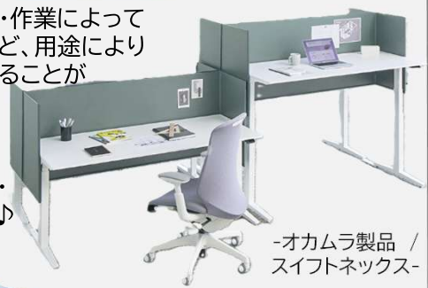
-オカムラ製品 / スイフトネックス-

体格に合わせる・作業によって姿勢を変えるなど、用途により机の高さを変えることができる「昇降式デスク」です。姿勢を変えることで作業効率・集中力もアップ♪